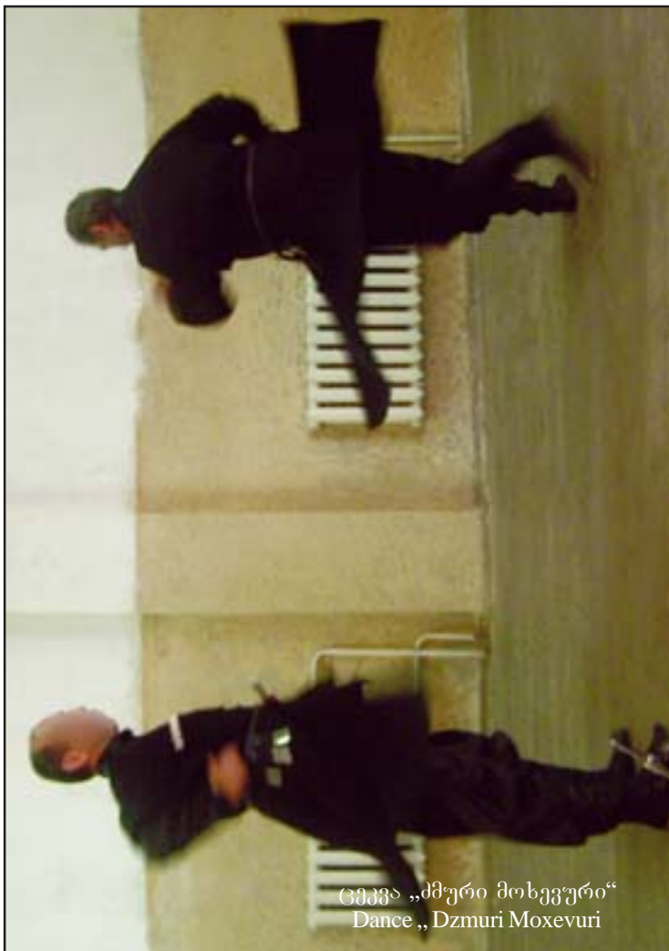
ცეკვა „ძმური მოხვევური“ Dance „Dzmuri Moxevuri“